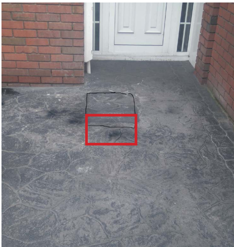
Aischur sealadach ar choincreít phriontáilte.

Má dhéantar dochar do na limistéir fhéir le linn na hoibre tochailte, déanfaidh ár bhfoireann a ndícheall iad a dheisiú, ag déanamh athshíolaithe san áireamh, más gá sin. Is féidir go gcuirfear moill ar dheisithe ar cheapacha bláthanna agus ar limistéir fhéir mar gheall ar fhachtóirí séasúracha.