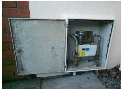
An bosca méadair agus an limistéar thart ar an méadar roimh an athnuachan seirbhíse.