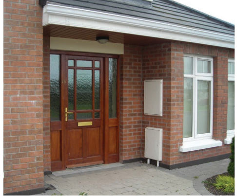
Sampla de bhosca méadair i limistéar ar féidir é a bheith iata.

Ní ghearrfar aon chostas ort as an obair a chuirfear i gcrích. Tabhair faoi deara, áfach, go mbeidh de thoradh ar an obair dícheangal sealadach do sholáthair gháis.